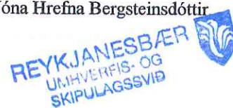
Jóna Hrefna Bergsteinsdóttir

Reykjanesbær Tjarnargötu 12 Póstfang 230 Sími: 4216700 Bréfasími: 4214667